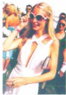
马球比赛现场总是充满了奢华的气息

说起马球，这项贵族运动其实与中国有着颇深的渊源。在我国古代，马球被称为击鞠，三国时曹植的《名都篇》中有诗曰：“连骑击鞠壤，巧捷推万端”，说明至少在我国汉末时期，马球运动就已经存在了。到了唐代，马球已成为我国盛行一时的运动，上自皇帝，下至王侯大臣，甚至妇女也成了参赛的一员。我国唐朝出土文物《打球图》